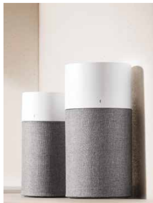
左：寝室などの個室に最適なBlue 3210（～25m 2 /15畳*） 右：リビングなどメインスペースに最適なBlue 3410（～57m 2 /35畳*）